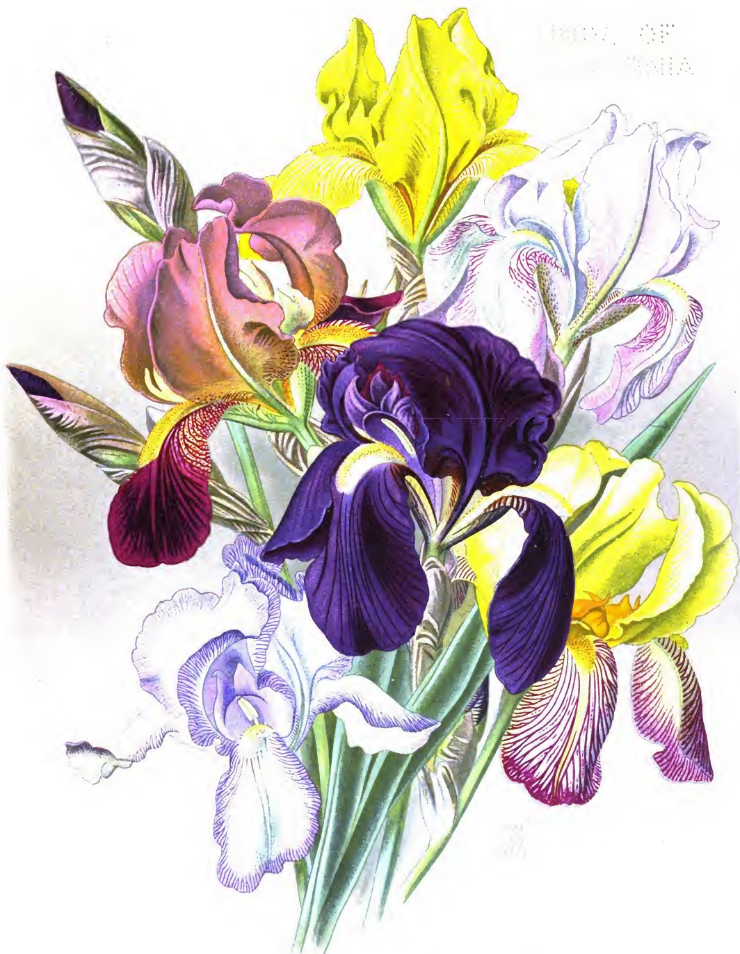
Iris germanica var.